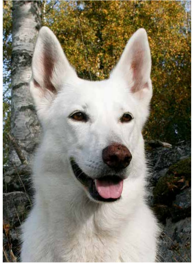
Tik medellång päls