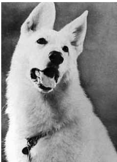
Lobo White Burch f. 1966

Översättning fastställd av SKKs arbetsgrupp för standardfrågor 2013-07-02