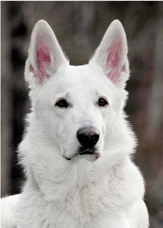
Hane medellång päls