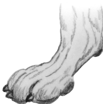
Vek eller smal mellanhand