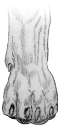
Normalt knuten tass