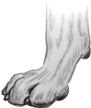
Normalt vinklad mellanhand