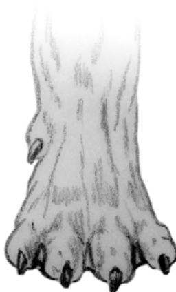
Löst knuten tass