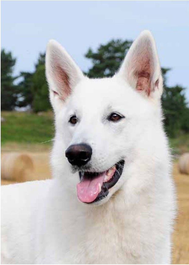
Ung hane medellång päls