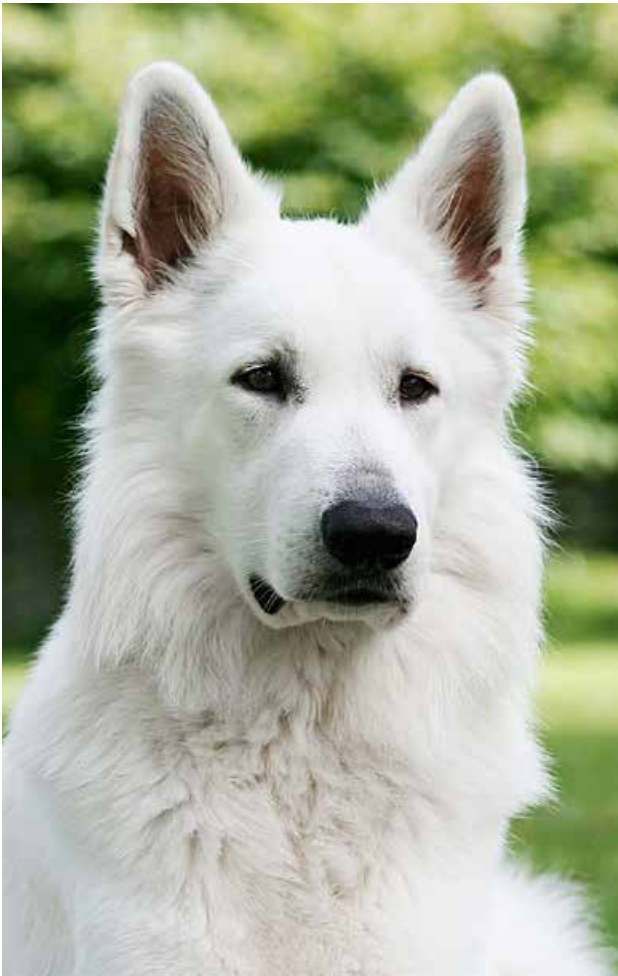
Hane långhår (mörka mandelformade ögon)