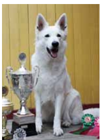
Barvestad's Cheops of Giza

Har du frågor angående medlemskap, hör av dig till medlemsinfo@vitherdehund.com. Information om medlemskap finns på www.vitherdehund.com