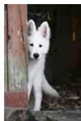
Barvestad's Rockin Robin

Har du frågor angående medlemskap, hör du av dig till medlemsinfo@vitherdehund.com